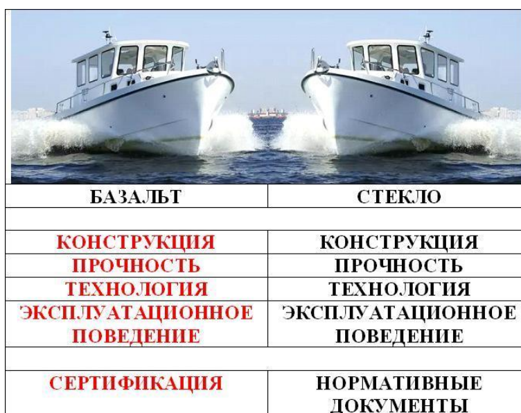
Рис. 2. Схема внедрения армирующих материалов на основе базальтового волокна

Выявление и изучение влияния различных эксплуатационных факторов на работоспособность конструкции, а также самой динамики их развития, дает ключ к оценке надежности и долговечности судовых корпусных конструкций из композитов. Исследование динамики развития дефектов позволяет достоверно оценивать изменение технического состояния корпуса судна из композитов в процессе эксплуатации, прогнозировать изменение его эксплуатационной прочности в течение всего срока службы и, в конечном итоге, делать выводы о долговечности конструкции в целом. Наблюдение за процессами развития дефектов с помощью различных методов неразрушающего контроля дает возможность в режиме реального времени оценить изменения механических свойств элементов судового корпуса из композитов в процессе эксплуатации, а также позволяет получить объективную информацию об изменении технического состояния корпуса в процессе эксплуатации [19-21].